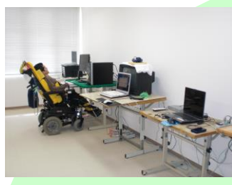
学習室(パソコン室)(2F)