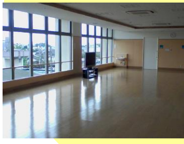
ダイニング・食堂