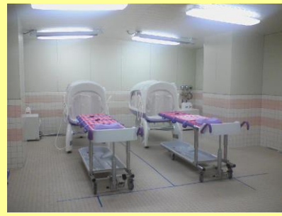
ストレッチャー式シャワー入浴装置