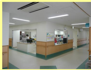
スタッフステーション