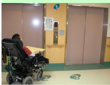
センサー式専用エレベーター