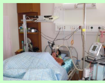
離床困難な方の社会参加(インターネット) (スタンド式モニターアーム使用例)