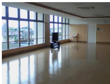
デイルーム・食堂