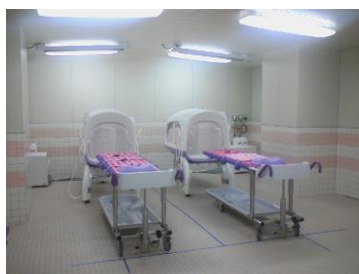
ストレッチャー式シャワー入浴装置