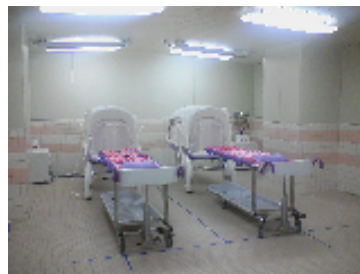
ストレッチャー式シャワー入浴装置